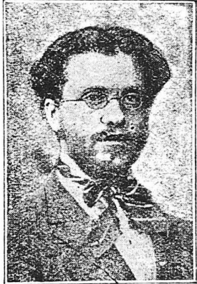
Ο Βλάσιος Γαβριηλίδης κατά την εποχή που πρωτοήθε στίς Αθήνας