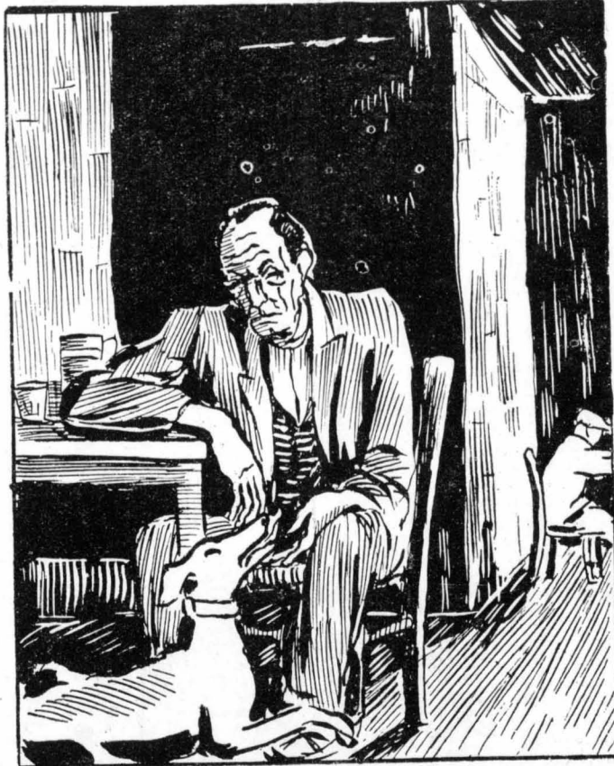
«Η Φλόξ πήγαινε κοντά του για να τή φιλέψη...»

Και τ' ά χόηματα σωνόντουσαν και ή πελατεία δεν