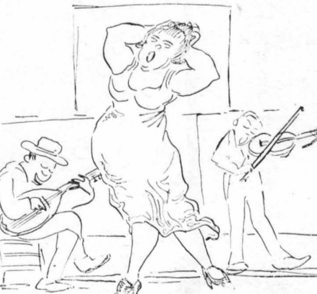
—'Αμαν, αμαν, Σμύρνη!...

'Εγὼ τέλος εἶμαι τυφλός. Μιλῶ καὶ δὲν βλέπω ὅτι εἶστε κουφοί.