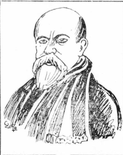
Ο Πάωλ ΒερλαΪν.