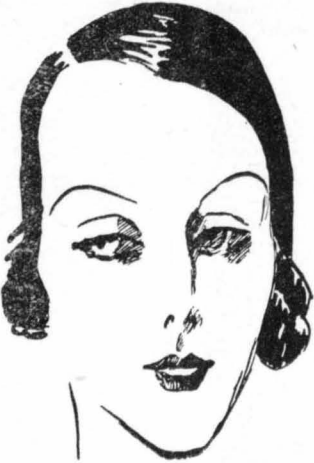
Η Άρλέττα Μαρσάλ, ή μεγάλη Γαλλίδα βεντετίνα τού βωδου κινηματογράφου, πού γυρίζει τώρα, έπειτα από μεγάλη άπουσία, τήν πρώτη όμιλούσα ταινία της.

—Και παραμένει πειά μυστήριο γιατί ή καλλιτέχνης έκαμε αυτή τήν καταγγελία έναντίον τού... έαυτού της!