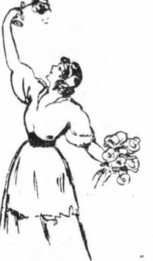
Η Ρακέλ Μελλέρ, ή παγκοσμίου φήμης Ίσπανίδα καλλιτέχνης, ή όποία έγύρισε πρό μηνός σέ όμιλούσα «βερσιόν» τής «Άντοκρατορικές Βιολέττες» πού υπήρξαν ένας από τούς θριαμβούς τού βωδου κινηματογράφου.