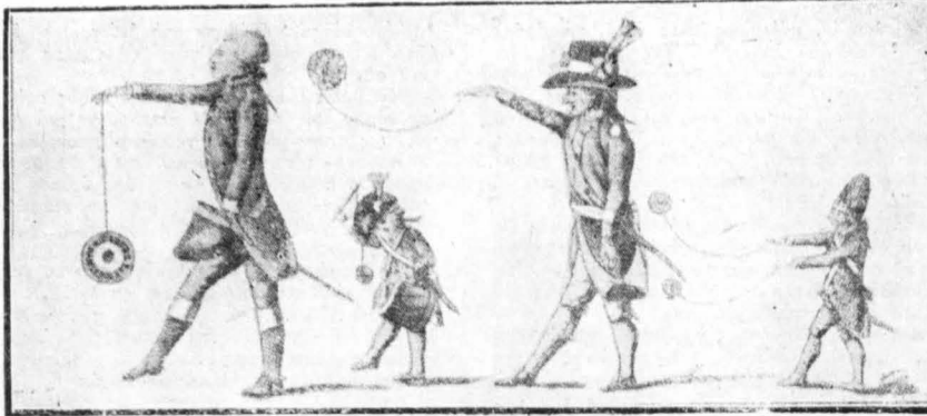
Τὰ γιό-γιό τῶν Ἐμυγκρέδων.

Ἐνα ἀπὸ τὰ πὸ πῆλαια καὶ τὰ πὸ περιεργὰ «δοκιμαθέντα» ποὺ ἔχομε γιὰ τὴν ἱστορία τοῦ γιό-γιό, εἶνε καὶ ἡ ὁμορφὴ προσωπικογραφία τοῦ μικροῦ «δοκίμου» τῆς Νορμανδίας, τοῦ μέλλοντος Λουδοβίκου XVII ἀπὸ τὴν κ. Βιζὲ Λεμπρέν, ποὺ βροῖκεται στὸ Μουσεῖον τῆς Ὠζέ. Ἀπειρὲς φωτογραφίες αὐτοῦ τοῦ πορτραῖτου δημοσιεύθησαν τὸν τελευταῖον καιρὸ σ' ὅλες τῖς Ἐυρωπαϊκὰς ἐφημερίδας. Καὶ ξέρετε γιατί; Ἀλλοῦστατα γιατί ὁ μικρὸς Λουδοβίκος, ποὺ ἦταν τότε —τὸ 1789— ἐπ' ἀνωτάτω τεσσάρων χρόνων, κρατᾶει —ὅπως βλέπετε καὶ στὴν εἰκόνα μας— μὲ τὸ δεξιὸν τὸ χέρι ἕνα γιό-γιό ἀπ' τὸ κορδόνι του. Ἦταν τὸ ἀγαπημένον του παιγνίδι.