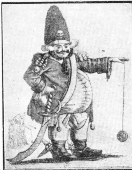
Ο όπκοκώης Μιχαήλω με το γιό-γιό του.

Το κείμενο κατόπιν το έγραφαν αναγλυφικώς σε σκελετά είδοια καλλιγράφα κιάλληρα, ένω άλλοι, επίσης είδοια, καταγινόντουσαν με την εικονογράφηση του περιοδικού, σαμάρωντας πολύχρους και καλλιτεχνικώτατες εικόνες από γίλια—δυό ζωχαροπλάστια μίγματα. Κάθε Σάββατο έδοδα που έξεδίδετο ή «Ζωχαροπλάστης έπιθεώρησης», έφερχαν οι κάτοικοι της Βολυμπόρης και κατάκλιαν το κατάστημα του έρευρητικού ζωχαροπλάστου, άδημιώνοντας να ιδούν το κανονίγιο σφύλλο και να καταβροχθίσουν κυριολεκτικώς και μεταφορικώς το περιεχόμενό του.