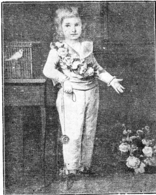
Ὁ μικρὸς Λουδοβίκος 17ος μὲ τὸ γιό-γιό του. (Πορτραῖτο τῆς Λεμπρέν).

Σὲ μὴ γελιογραφία μάλιστα ἐκείνης τῆς ἐποχῆς, ἡ ὁποία φυλάγεται σήμερον στὴν Ἐθνικὴ Βιβλιοθήκη τοῦ Παρισιοῦ καὶ τὴν ὁποία δημοσιεύομε ἐδῶ, βλέπομε τὸν ὑποζυγίτη Μιραμιτό, τὸν περιφρῶ «Μιραμιτό Τονό», ὅπως τὸν ἔλεγαν τότε, γιατί ἦταν χοντρός σὰν βαρέλι, μὲ τὴ μεγάλη στολὴ τῆς λεγεῶνος τῶν οὐσάσων τοῦ θανάτου, νὰ παῖξῃ μὲ τὸ ἀριστερὸν τὸ χέρι μὴ «Ἐμυγκρέττες». Στὸ βάθος, ἕνας διπλὸς οὐσάσιον παῖξῃ κα' αὐτὸς μὲ τὰ γιό-γιό του! Σ' ἄλλες πάλι σατυρικὰς χαλκογραφίαις τῆς ἐποχῆς βλέπει κανεὶς ὁλόκληρα συντάγματα μὲ τοὺς ἀξιώματικούς τους ἐπὶ κεφαλῆς, νὰ εἶνε ὀκλιωμένα... μ' «Ἐμυγκρέττες» καὶ τοὺς τιμηκανιστὰς νὰ παίζουν τὸ τῆμασόν τους, χτυπώντας το μ' ἕνα γιό-γιό!