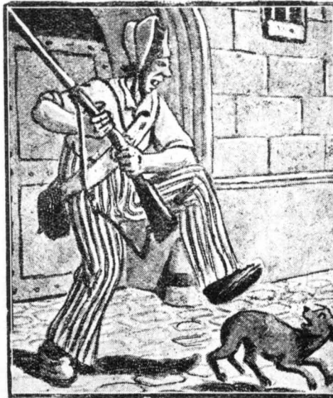
Οὔτε ἡ πείνα, οὔτε ἡ κλωτσιές τῶν στρατιωτῶν μποροῦσαν νὰ τὸν ἀναγκάσουν νὰ ἐγκαταλείψῃ τὴ θέσι του.

Ἐφραξαν λοιπὸν ἓνα χῶρα στὸ γηροῦ τοῦ Ἁγίου Λουδοβίκου καὶ