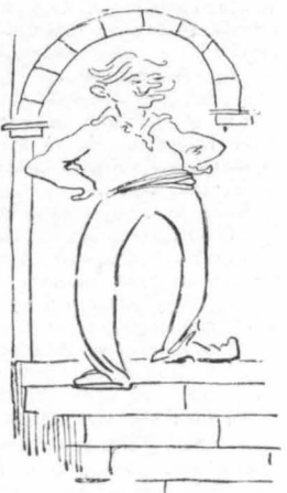
— Τί άγαπάει ο κύριος;