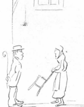
Και παίρνει μιὰ καρέκλα και με παρακαλεί ν' ανέω επάνω.