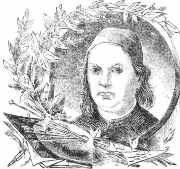
Ο διδάσκαλος τού μεγάλου ζωγράφου Ραφαήλ, Πέτρο Περοντζίνιο. (Αποπροσωπογραφία).