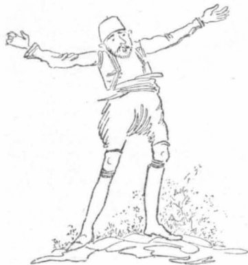
— Για τo Θεό, μορφέ παιδιά!...

— Δέν μου λές, κυρά μου, έλεγε ο Καραγιώζης στη βασιλοπούλα, παντρεμένη είσαι;