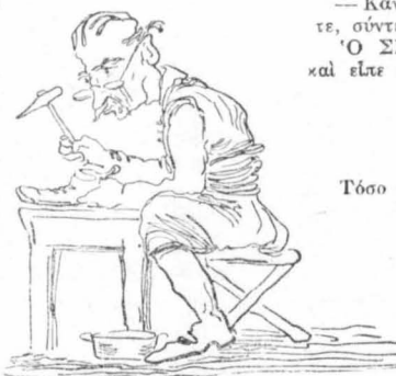
“Όλα μου τa παράτησα, σουβλιά και καλαπόδια...”

Δέν μπορούσε τώρα παρά να γελήσει κι' ο Άλεξογιώργης. Γελούσαν όλοι. Ή γυναίκες, ο Μαλακιώτης, άκόμα κι' ο Τουρκος. Μόνο τo γαϊδουράκι δέν... γελούσε. Δεμένο άπ' τa πόδια με τa σχοινιά και πεμμένο άπάνω σ' ένα σωρό πέτρες, άγκομαχούσε, γούρλωνε τa μάτια του και μάζευε τα χείλη του, από τόν πόνο ίσως του χτυπητήματος, που εφαγορίζανε τa κτριμισμένα του δόντια, σαν να γελούσε και τo ίδιο.