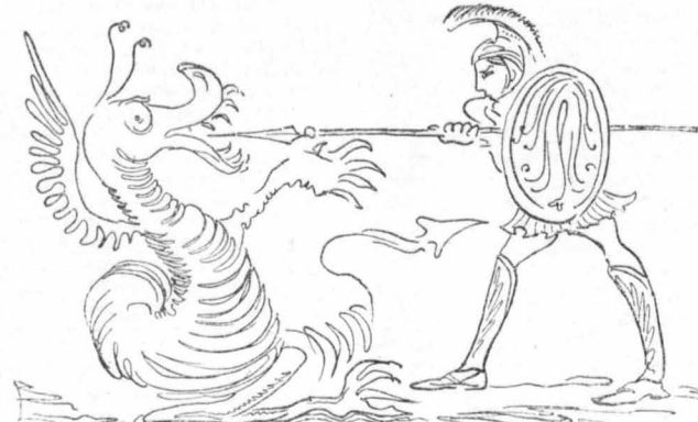
— Καταραμένε όφι!...

“Όλα μου τa παράτησα σουβλιά και καλαπόδια, Σάν άκουσε λοιπόν τa χάχανα και τή φασαρία, άφησε κι' αυτός τή δουλειά του βιαστικό, και κατέβηκε ως εκεί για να μάθη τί τρέχει.”