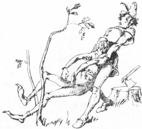
Η θεραπεία τ' όν... κήλης!...

Μά δέν είχαν μονάχα θεραπευτική όδύναμη όλα αύτά τ' όν μαγικά μέσα. Είχαν και ιδιότητες προληπτικές έναντιον τ' όν άσθενειών. Π.χ., άν έδενε κανείς στή μέση του κρεμμύδια, τ' όν όποια είχε άγορδίσει χωρίς πολλά παζάρια, στήν τιμή που είχε προτίνει ο Θεός, ήταν άπαλλαγμένος από τ' όν ζαλάδες. Έπίσης, άν φορούσε κρεμμυσιένο στο