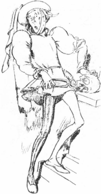
Βγάζοντας ένα δόντι από μια νεκροκεφαλή... εθεράπευαν τον δικό τους πονόδοντο!...

(Συνταγές και θεραπευτικά μέσα που προκαλούν φρίκη και άηδία)