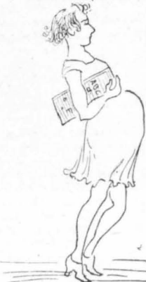
"Έγιναν άρκετές... συλλήψεις!..."

— Καί πού ήσασταν, βρε εδολογημένοι!... Κι' εγώ νόμισα, για μιá στιγμή, πώς σάς άρπαζαν ή νεράιδες! ελεε ό Τουλμπιδόνης στους καλογήρους όταν τους άντίκρισε.