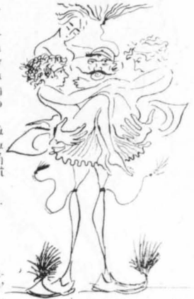
Κι' ό λοχίας Καραφούν- τας τρεις!..."