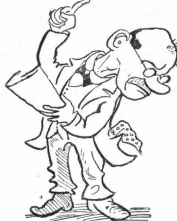
— Σι κολάνανε ή νεράιδες, καί- μένε!..."

Μόνο πού μετά τó φαγητό, πήγαιναν όλοι μαζί πειά στό πο- τάμι.