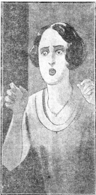
Ἡ 'Οδέττη ἔβγαλε μιὰ τρομερὴ κραυγὴ καὶ τραβήχτηκε πίσω...

Αὐτὸ τὸ τερας ἦταν ὁ ἄνδρας τῆς. Ἐτρεπε λοιπὸν νὰ μείνῃ