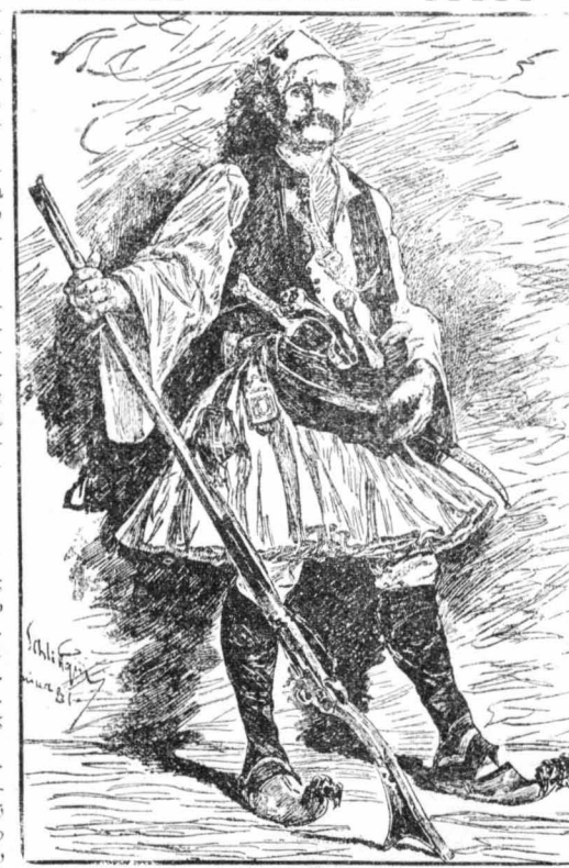
Ο ΑΡΒΑΝΙΤΗΣ (Τού Χάουπμαν).