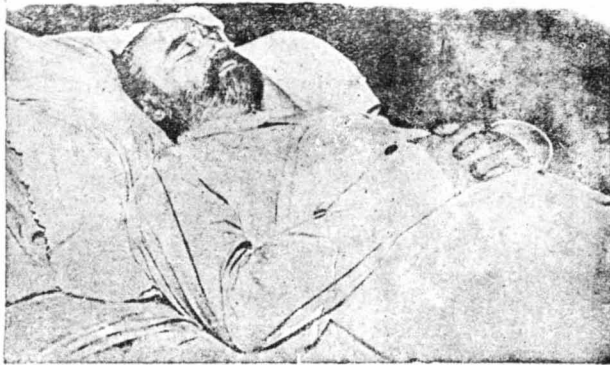
Ο συγγραφέας του διηγήματος Αιμίλιος Ζολά, στη νεκρική του κλίνη.