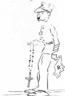
Ἐχον σταυροῦσ ἢ νεραῖδεσ, σκέφτηκε ὁ ἐνοματάρχησ.

γαλόνια τὰ λευκά καὶ τὰ πολλὰ κομμάτια τὰ ἐπαφρωσμένα, ἐξαιτήσθηκε ἀπὸ πάνω του καὶ χάθηκε μέσα στὶς προῖνεσ τίς ἄγχεσ, κα' ὅτι στὴ θέσι του δὲν ἀπόμεινε τίποτ' ἄλλο ἀπ' αὐτόν, παρὰ ἕνα μικρὸ παιδάκι, κακοτυπμένο κα' ἀτημέλητο, ὅπωσ ἦταν στοῦ χωριό του μικροῦσ... Καὶ μᾶζυ μ' αὐτόν ἄλλαξαν καὶ τὰ δέντρα — πῶσ μὲν σ' ἔχο, Σατανά! — οἱ λόφοι, ὁ δρόμοσ, τὸ ποτάμι... Ἀλλάξε ἀόμοια κα' ἡ ἀποστολή του ἐκεῖ πέρα. Δὲν παραμῶνεσ πειὰ ἐκεῖ ὁ ἐνοματάρχησ τίς ὑποπτεσ ἐμφανῖσεσ ἔστικῶν, ἀλλὰ τὸ μικρὸ παιδάκι τῆσ παλῆσ του καταστάσεωσ, δταν κρυφοκῦτᾶξε τὰ κορίτσια τοῦ χωριό πὺν κατέβαναν νὰ πλύνον. Κα' ἔβλεπε πᾶλι τότεσ, ὅπωσ μιὰ φορὰ, κνήμεσ ροδοκόκκανεσ σάν χαρᾶγῃ, μεσοφροσῶνα νὰ φουσκῶνον ἀπ' τὸν ἄερα, ἔβλεπε ἀτηγροῦνεμένεσ καμπελοῦτεσ πὺν τοῦφεραν μιὰ ζῆλη στὸ μωλό, τὸν παρῶλαν τὸ σῶμα καὶ τοῦ ἔλυνον τὴν ὑπαρξῃ.