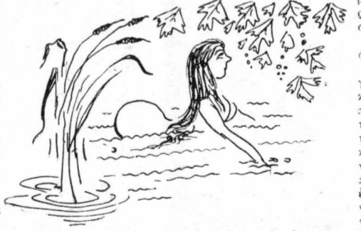
Γδῶθηκε κα' ἔπεσε νὰ κολυμπίη στὸ ρέμμα...