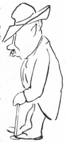
Ἐο ταμῖα ἢ ὁ Μονοπόλιοσ;