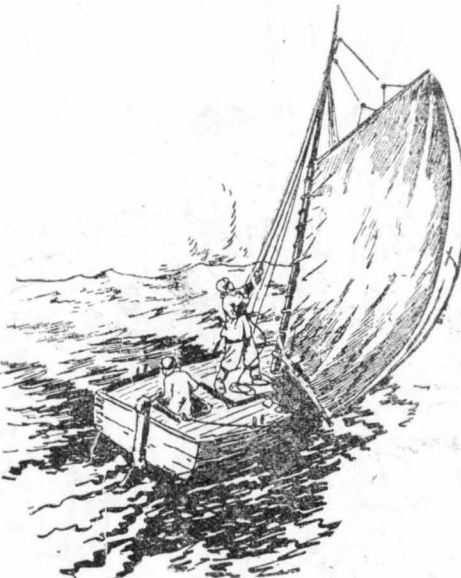
Τραβήξαμε προς την ακτή, σ' ένα μέρος ερημικό...

Φανταζόμαστε πόσα πόσα φράια θα ήταν στο μεγάλο λιμάνι της Νουμέας. Η Μάγα θάχόχταν να μιάς προίπαντηση με τη βάρκα, Κι' ή Μπίβι, ή φιλενάδα της, θα ήταν μαζί της. Η Μπίβι περίμενε εμένα... Έπειτα θα τραβούσαμε κοντά για να βγούμε στη στεριά. Η χουμαδιές θα λούσαν τα ψηλά στεφάνια τους στο θερμό φως του φεγγαριού. Κι' εμείς θα πλανόμασταν από κάτω τους... Έτσι γινόταν