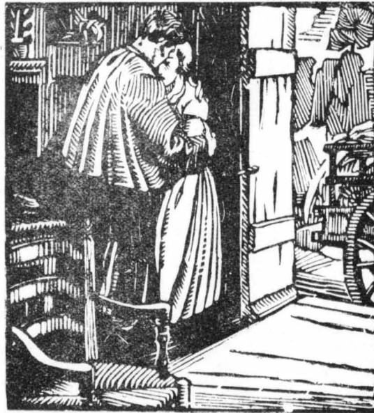
Τὴν ἀγκάλιασε, τὴ φίλησε κ' ἀποχωρίστηκαν κλαίγοντας σιωπηλά...

Ὁ χοροφύλακας προχώρησε περὶφανα, κάθισε στὸ χάλι κ' ἔπιε ἓνα μεγάλο τάσι καφέ ποῦ τοῦ τὸ σεβόρισε πάλι ὁ δῆμαρχος. Ὅταν