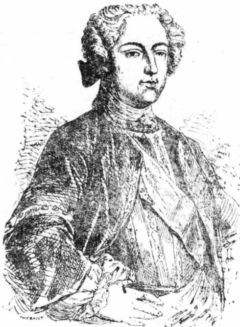
'Ο Λουδοβίκος 15ος.