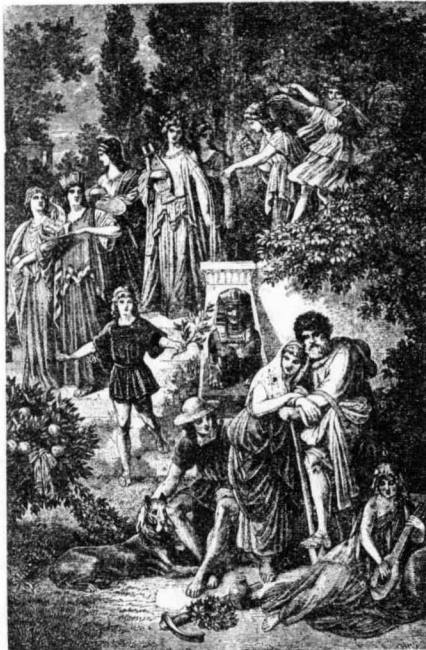
'Ο λαός της Κόρινθου, έτοιμαζόμενος να ύποδεχθί τη Λαΐδα.

Κάποτε φώναζε έναν απ' τους καλύτερους υδραυλικούς της Κόρινθου, για να της έπισκευάσει τις βρύσες των κήπων της. "Η