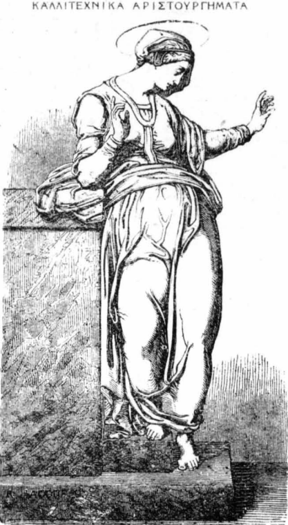
Ο ΕΥΑΓΓΕΛΙΣΜΟΣ (Ἔργον τοῦ Μιχ. Ἀγγέλου καὶ τοῦ Μάρκου Βενεδοῦ).