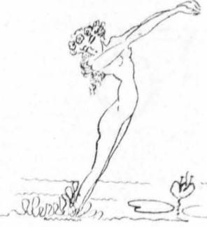
Ἦταν σάν δατασία, σάν ὄνειρο...

Γιὰ μιὰ στιγμή τοῦ φάνηκε στὰς κᾶτι μαῦρο πὸν κρυβόταν ἐκεῖ πέρα, κινήθηκε καὶ χάζηκε μέσα