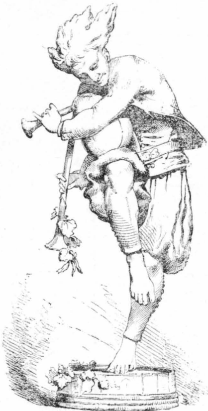
Ο ΧΟΡΕΥΤΗΣ ΜΕ ΤΗ ΓΚΑ'Ι'ΔΑ (Έργον τού Σάρλ Λε Μπούργκ).