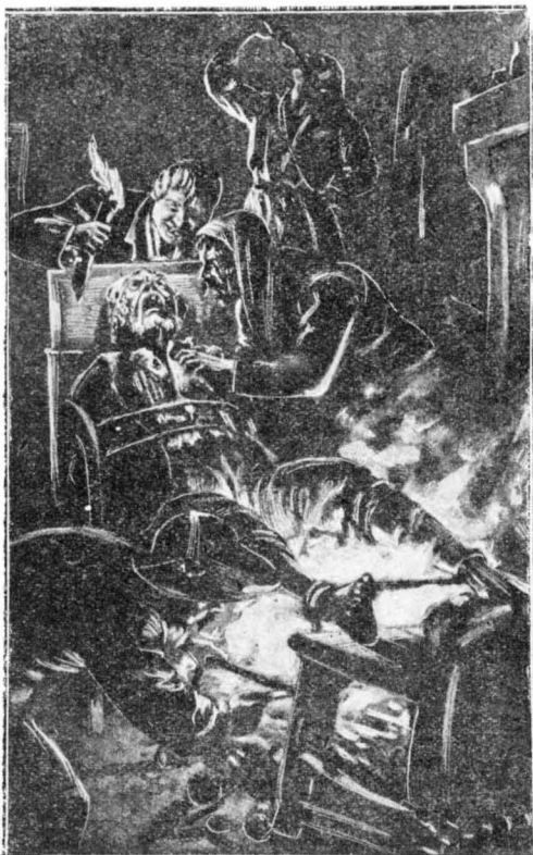
Τὸ φρεϊκὸδες μαρτύριο τοῦ Μάρμιλα-Φουσε.

Ἀμέτρητες μαχαιριεῖς ἀπ' τοὺς κατὰμαυρους αὐτοῦς διαβόλους κομμάτισαν τὸ κομμὶ τοῦ γυοῦ Φουσε... Ὁ πατέρας Φουσε, δεμένος χειροπόδαρα καὶ σφιχτὰ σὲ μιὰ πολυθρόνα, ἀρνιόταν νὰ μαρτυρῆσῃ ἄν