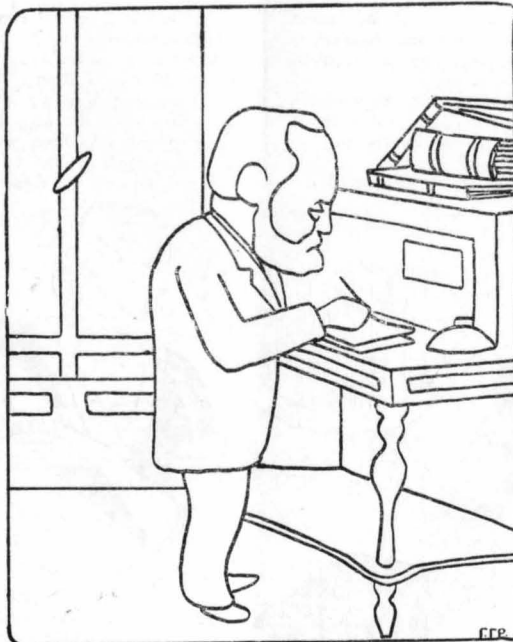
'Ο Βίκτωρ Ουγκώ έγραφε όρθιος στό γραφείο του...

'Άλλοιώς, πρόσεξε, 'Ιουλία, πρόσεξε, άγαπημένη μου... 'Άλλοιώς τό βάρος τό τεράστιο θά με τσακίση γρήγορα. Και πριν με τσακίση, 'Ιουλία μου, φώδε τόν ματσών μου και χαρά της ψυχής μου, πρόσεξε! Θά πετύχω πριν σβύσω, νά... σβύσης κ' εσύ μαζί μου!