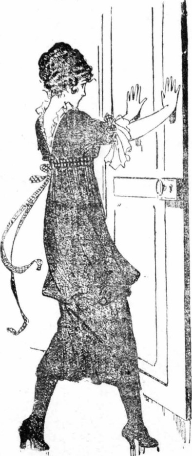
Χτυποῦσε, χτυποῦσε κ' ἔσπρωχνε τὴν πόρτα, πιγμένη ἀπὸ φόβου...

Μὰ αὐτὸς δὲν καταδέχτηκε οὔτε νὰ τῆς ἀπαντήσῃ. Ἡ Ἀγάθη ἦταν δική του. Τοῦ τὴν εἶχαν δώσει. Ἦταν τὸ ἀγαθὸ του. Κάνει δὲν εἶχε τὸ δικαίωμα ν' ἀνακατευθῆ σ' αὐτὴ τὴν ἰσθόβησι καὶ γι' αὐτὸ ἐξακολουθοῦσε νὰ ἔχῃ τὸ χέρι του ἐπάνω στὸν ὄμο τῆς, σὰν νὰ ἦταν