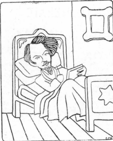
'Ο Βιλιέ ντε λ' 'Ιλ 'Αντάμ συνήθισε να γράφει στο κρεβάτι του.

(Συνήθειες, αδυναμίες, εξωφρενισμοί, ψυχώσεις, κτλ. κτλ.)