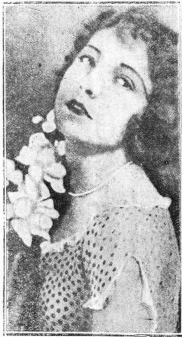
Ἡ Μαίρη Πίκφορντ.

Κι' αὐτὸς, ὁ σκληρὸς κοροῦδευτῆς πρὶν ἀπὸ λίγη ὥρα, ἄρχισε τώρα νὰ κλαίῃ σιωπηλὰ καὶ πικρὰ, χωρὶς νὰ ξέρῃ καὶ αὐτὸς καλά γιατί...!