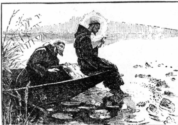
'Ο Άγιος Φραγκίσκος τῆς Ἄσιζης, δίδασκον τὰ ψάρια. (Πινᾶξ τοῦ Ε. Ποπιόν).