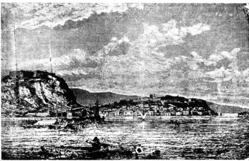
Η Κέρκυρα κατά τις άρχές τού περασμένου αιώνας.

Σύγχρονα με τόν «Ιονικό Μηνύτορα» βγήκε και τό πρώτο ελληνικό περιοδικό στην Ιταλική με τόν τίτλο «ΦΙΛΟΛΟΓΙΚΟΣ ΕΡΜΗΣ» (MERCURIO LITERARIO) και με αννεργάτες τούς καλύτερους 'Επτανήσιους τής εποχής, ανάμεσα στους όποιους πρέπει να μνημονεύσουμε και τόν 'Ιωάννη Καποδίστρια, συγγραφέα πολλών άρθρων τού περιοδικού. Τόν «Φιλολογικό Έρμη» διηγήθη ο Σπυρίδων Θεοτόκης, ένας από κείνους που ίδρυσαν τή δημοκρατική εταίρεια τών Φίλων και πού με πάθος ελεγε άσπασθεί τις ιδέες τής Γαλλικής Έπαναστάσεως για να τις άγινή άργότερα. Η έκδοσις τού άρχισε τήν 1η Νοεμβρίου 1805 κι' έχουμε τέσσερες τόμους τού άξιολογώτατου τούτου περιοδικού. Ανάμεσα στα περιεχόμενά του σιγαντάει κανείς ένδιαφέρουσες φιλολογικές κι' αρχαιολογικές μελέτες, πολλά λυρικά ποιήματα στην Ιταλική κι' ένα-δυό στην ελληνική. Μά πουθενά δέν βλέπει τό πικάντικο εκείνο πνεύμα πού θα περιέμενε κανείς από φιλολογικό περιοδικό τής 'Επτανήσου. Για να αντίληφθή κανείς και τήν κατάσταση τής τότε γλώσσας, παραθέτουμε τή μετάφρασι ενός λατινικού έ-