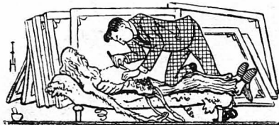
Τόν έξύρισα και τόν πετσόκοπα σε τέτοιο σημείο, που αντίς για Άφροδίτη, έπόζαρε ως Άγιος Σεβαστιανός!