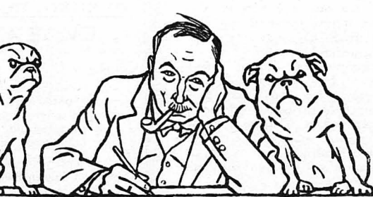
Ο Γερμανός ζωγράφος Θωμάς Χάινε.

»Ένας άλλος ζωγράφος, φίλος μου, είχε τήν ιδέα πως δεν μπορούσε κανείς να εμπνευσθή, αν δεν ήταν και τó περιβάλλον άνάλογο τó θέμα που ήθελε να ζωγραφίση. Ο ζωγράφος αυτός είχε ιδιαίτερη άδυναμία στην άπειρόνια σπηλιών άπό τήν αρχαία Γερμανική ιστορία ή άπό τις άπρες τού Βάρνερ. Ήταν κοντός,