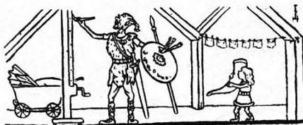
Ντυμένος σαν αρχαίος Γερμανός, ζωγράφιζε σκηνές άπό τήν αρχαία γερμανική ιστορία!