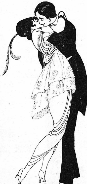
Φιλιούντα... 'Ο άντρας της κι' ή πιο στενή της φίλη!...