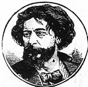
Ο Άλφονσός Ντωντι.