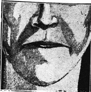
Το στόμα του κακού ανθρώπου.

λημένοι ψυχικάς. Η παραφονία των χροματιστών σημαίνει και παραφονία φυσική και ψυχική. Γενικώς, όσοι έχουν μαύρα μάτια, είναι έπιμονοί, δεσποτικοί και φιλογοφοί στον ερωτά τους.