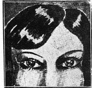
Τα μάτια που εκφράζουν το αισθήμα.