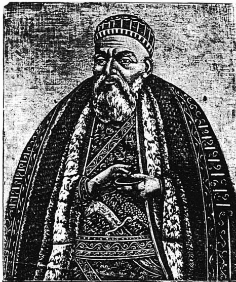
Ο Άλη Πασάς.