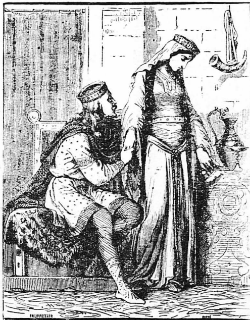
Ο Αυτοκράτωρ Κωνσταντίνος κάλεσε την αδελφή του και της έξηγήσε την τραγική ανάγκη...

— Η ψυχή των δικαίων ανθρώπων βλέπει στον ύπνο της έναν οφρανό μυστηριώδη.