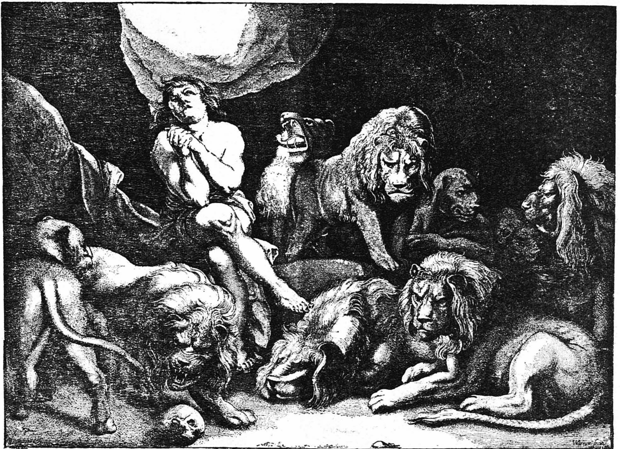
Ο ΔΑΝΙΗΛ ΕΙΣ ΤΟΝ ΛΑΚΚΟΝ ΤΩΝ ΛΕΟΝΤΩΝ