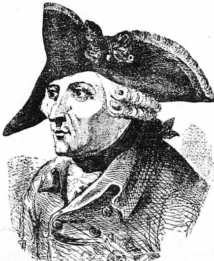
Ο Μέγας Φρειδερίκος.