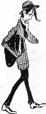
Και στρίβει, κάνοντας τήν πάμια...