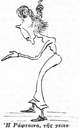
Ή Ράφταινα, τής γειτονιάς ή γλώσσα ή μοναδική.