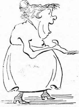
Τό βεβαίωσε και ή κυρά Μαρίνα.