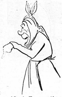
— Ωχού, Χριστιανοί!... Τό κόνισμα πού μου κλέψαν!...