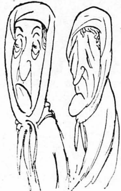
Σαφνιασμένες ή γρηούλες έβγαϊναν στις αλλές...

Τό είχε ειπεί ο Λιάσκος ο Κορβάς, ο πρώτος του χωριού μπεκρής, και άδονησι δέν έπαυρε χαμιά. Τήν είδε δλοζώντανη τή Χάρι της, τή νύχτα πού κοιμότανε! Ή ίδια ή μελαγχολική Παναγία τού έγκαταλειμμένου μοναστηριού τού 'Αη-Γιάννη-Χλωμή σάν άρρωστη, με τά κατάρματα τά μεγάλα της μάτια και τή γλώσσα της κοινοβόλα στό κεφάλι. Τόν είχε πλησιάσει και τού έδειξε με τά λιανά της δάχτυλα, τά χλωμά και άδύνατα σάν κεριά δεκάρικα: