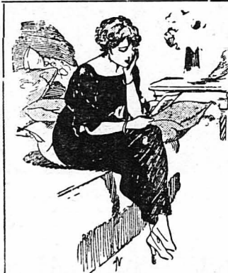
Σκυμμένη στο γράμμα, χάνεται ξανά στα περασμένα...