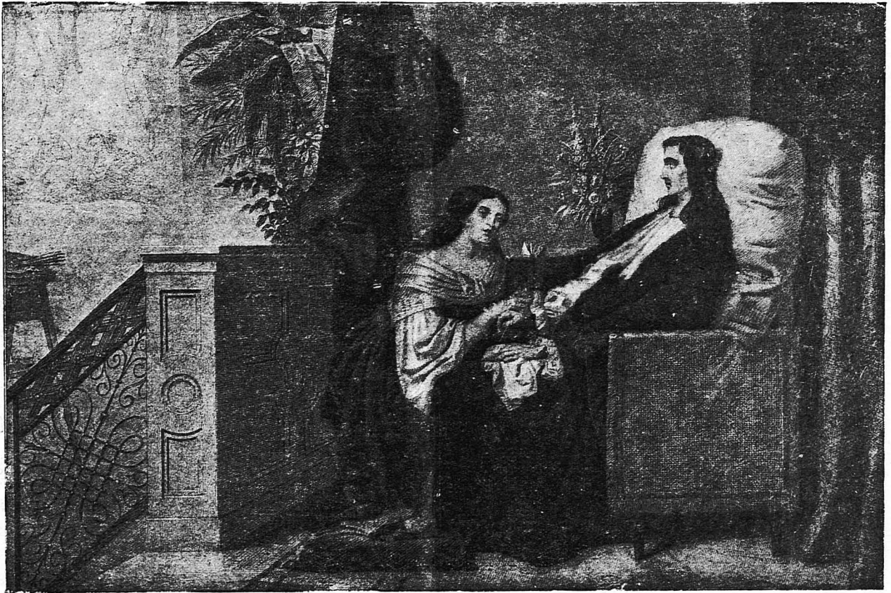
Η ΤΕΛΕΥΤΑΙΑΣ ΣΤΙΓΜΕΣ ΤΟΥ ΜΕΓΑΛΟΥ ΙΤΑΛΟΥ ΖΩΓΡΑΦΟΥ ΡΑΦΑΗΛ