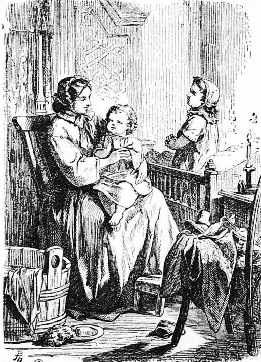
Όλα πήγαιναν καλά τότε και τα παιδάκια τους συμπήρωναν τη χαρά και την ευτυχία τους.