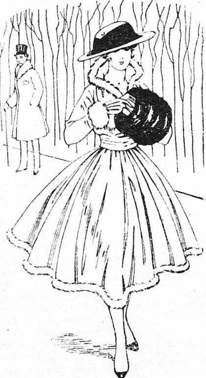
Τὴν εἶδε ν' ἀπομακρύνεται χαριτωμένη, κομψή, ξέγνοιαστῆ...