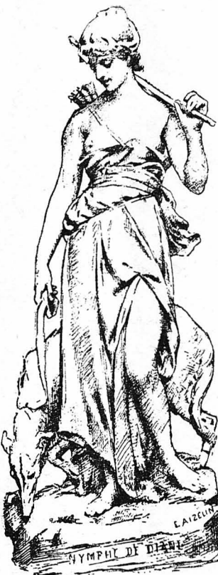
ΝΥΜΦΗ ΤΗΣ ΑΡΤΕΜΙΔΟΣ