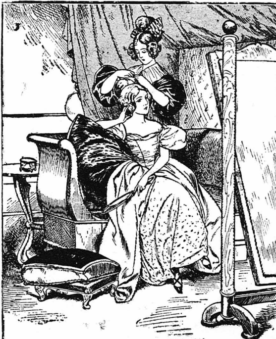
'Ενὸ ἡ Λουίζα μ' ἐχτένιζε, ἡ σκέψι μου πετοῦσε στὸν Γάστονα.

Ἡ τελευταῖες αὐτὲς λέξεις τοῦ μοῦ ἔκαναν μεγάλη ἐντύπωσι... Μ' ἔκαναν νὰ φαντασθῶ ὅτι πραγματικὰ ὁ Γαστὼν εἶχε δωροδοκῆσει