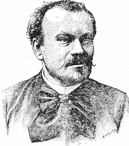
Ο συγγραφέας τού διηγήματος 'Ιούλιος Λεμαίτρ.