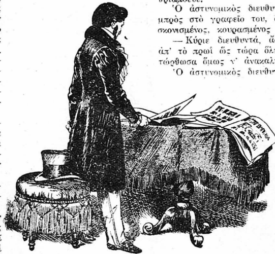
Ό άστυνομικός διευθυντής ξεφύλλιζε διάφορα έγγραφα, όρθιος μπρός στο γραφείο του.

Πριν ό κατάσκοπος προφτάσει να συνέρθη άπ' την έκπληξη και την ταραχή του, όι καραμπανιέροι τόν έπασσαν και τόν κάρφωσαν άκίνητο στη θέα του. Ό άστυνομικός διευθυντής πήρε τότε τό