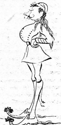
"Έπιλοχίας Γιώργου Καραμοτόρος!"