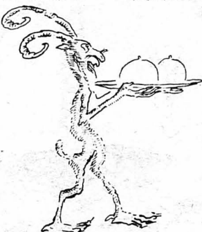
— Πισω μου σ' έχω, Σατανά, και μπροστά μου σε βλέπω!...

Άλλά τ'ό μωρό άρχισε να κλάμματα κι' ο έπιλοχίας, πρώτη φορά έχοζόμενος σ' έπαρη μ' ένα τέτοιο θηριο, δέν ήξερε πώς να τ'ό περιποιηθώη και πώς να τ'ό ησυχάση. Έκανε να τ'ό πάρη στα χέρια του, φοβόταν μην τού πέσει... Τού κουνούσε τ'ό φέσι, τού χτυπούσε τήν ξιφολόγη του. Τίποτε ένενο, άμέρωτο: — Ουά! Ουά! Ουά!... Έστριγγίλιζε σάν τ'ο τσαζάλι, φώναζε σάν άγροφότος! Άπαιδηρόμενος πειά ο έπιλοχίας, στάθηκε. — Δωσε μου είκοσι κλέφτες, είπε σάν να μιλούσε με τόν Θεό, νά τούς καταφέρω, αλλά τούτο δω τ'ό βλάσ! τί να τ'ό κάνω;... — Ουά! Ουά! Ουά!... — Τί διάλο να βέλη; σκεφτόταν ο άποσπασματάρχης και γούρε ένα γούρο τ'ό βλέμμα του.