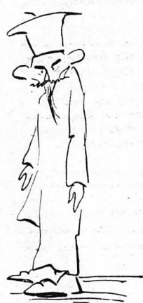
"Ήτανε ένας πατάς Ούνιτης!"

διάφορες προπαγάνδες τους, όσο ο Καλλισθένης ο Φούντας, γνωστός ζωοκλέτης και αένταλματίας». Άπεναντίας μάλιστα, τ'ό θεωρούσε κι' έπιτυχία τ'ό ότι θά κατέλυε στού Ούνιτη.