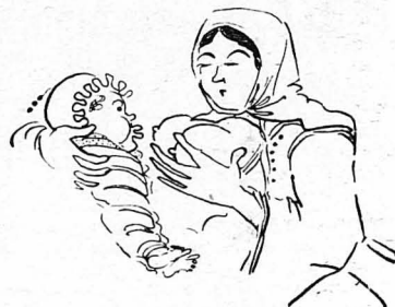
— ... 'Ουά!...

Μόνον που όταν πήγε στο σπίτι, έλειπε ο πατάς. 'Η παπαδιά, μιιά στρογγυλή και τριζάτη γυναικούλα, μάλις τόν ελδε ταραχτηκε. "Όταν δυος κατάλαβε ότι ο έπιλοχίας ήταν ξένος και περαστικός, έτρεξε να τόν περωτοιθώη. Και βγήκε μιιά στιγμή έξω για να οικονομήση ποτήρια, πιάτα, τραπεζοκάντηλο, άφίνοντας τις μεγαλοδομαδιάτικες δουλειές της. Και τί δουλειές; Ένα σωρό. Έλγε να καθαρίση τ'ό σπιτάκι της, να βάρη τ' αυγά της, να λύνη όλα τ'ο νοικοκυριού της τα χρειαζόμενα, για τ'η μεγάλη ήμερα της Λαμπρής. Γιατί ή κακομοίρα ή παπαδιά δέν ήτανε Ούνιτισσα. Άπεναντίας μάλιστα, ήτανε Χριστιανή και πολύ θρησκα!... Και άν έπηρε τόν Ούνιτη τόν πατά, τόν κακό και τόν άφορεσμένο, τόν πήρε από ανάγκη κι' από φτώχεια, Χρωστούσε ο πατέρας της και θά τόν πιάνανε. Πλήρωσε λοιπόν ο Ούνιτης τού πατέρα της τα χρέη. Και εις άντάλλαγμα, τού έδωσε αυτή τα νεύα της και τήν όμορφιά της, τ'ό κορμί της και τ'ό είναι της. Μά όχι και τήν καρδιά της!