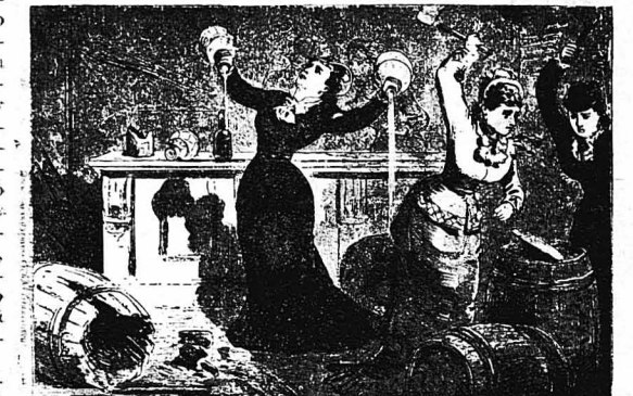
Ο ΑΓΩΝ ΕΝΑΝΤΙΟΝ ΤΟΥ ΑΛΚΟΟΛΙΣΜΟΥ.—Αμερικανίδες καταστρέφουν τὰ βαρέλια καὶ χύνουν τὰ κρασιά σ' ἕνα οἰνοπωλεῖο!...