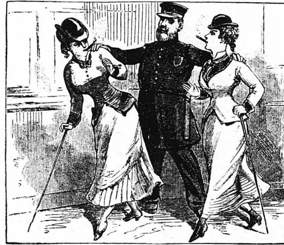
ΠΡΟ 50 ΕΤΩΝ.—Δύο νεαρές Αμερικανίδες συλλαμβάνονται γιατί εκάπνιζαν πούρα στο δρόμο!...

Αν οι άνθρωποι αυτοί φανταζόνταν τή οινονομική τής Αμερικής, ή έγκληματιζότης και ή διαφθορά άνθρώπων και πρό πενήντα χρόνων, όπως και σήμερα.