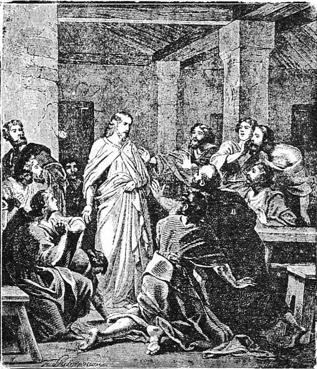
'Ο 'Ιησους εμφανιζόμενος εις τους μαθητάς του.